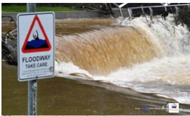
Dégats des inondations en Australie

L'Australie sous les eaux, les évacuations commencent p.4