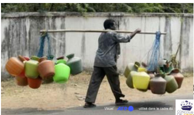
Un nigérien qui porte de l'eau

Le 22 mars, la journée mondiale de l'eau p.8