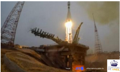
Lancement de "Challenge One"

«Challenge One» le premier satellite Tunisien p.6